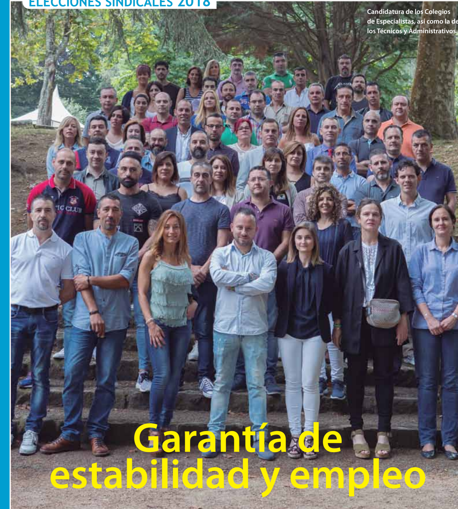
Candidatura de los Colegios de Especialistas, así como la de los Técnicos y Administrativos.