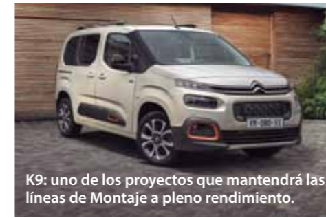
K9: uno de los proyectos que mantendrá las líneas de Montaje a pleno rendimiento.

Para ello es imprescindible que la mayoría del Comité sea firme y esté centrada en exclusiva en los objetivos que aporten un porvenir fructífero a la fábrica y a sus trabajadores.